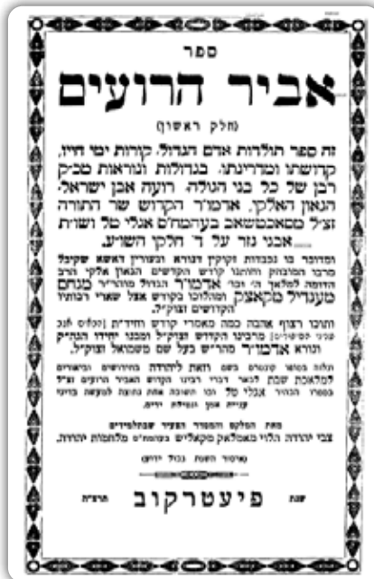
ספר 'אביר הרועים' - סאכטשאב

אחד מתלמידי סאכטשאב מספר בזכרונותיו עוד על ישיבתו של האיבני נזר זי"ע שהסבו עליו רבנים וגדולי תורה, ביניהם רבינו זי"ע והגאון בעל 'חלקת יואב' מקינצק זצ"ל, וכך אמר האיבני נזר בדברות קדשו: