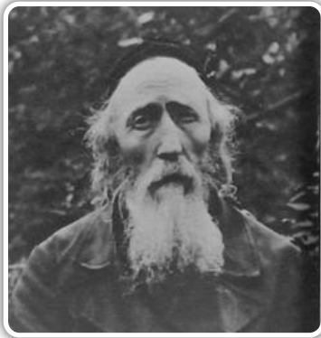
הגאון בעל 'חלקת יואב' זצ"ל

ואף שלא נחשב רבינו ליחסיד סאכטשאב' מן המניין, הרי שהיתה בלבו הערצה והערכה גדולה עד מאוד אל האיבני נזר, הן בזכות גדלותו העצומה