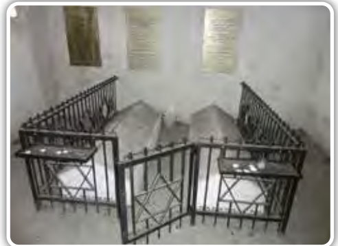
מצבות קדשם של הגה"ק בעל 'אבני נזר' מסאכטשאב זי"ע בנו הרה"ק בעל 'שם משמואל' זי"ע ונכדו הרה"ק בעל 'חסדי דוד' זי"ע

של האיבני נזר זי"ע, שאליו אמר רבינו את הדברים. וראה גם שיח זקנים' ח"ז עמוד שיא, מפי הגה"ח ר' אברהם חיים פרידמאן שליט"א ששמע מפי הרה"ח ר' שמואל אזנאווסקי ע"ה, ששמע גם הוא מפי בעל המעשה.